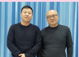
商贸公司销售二部