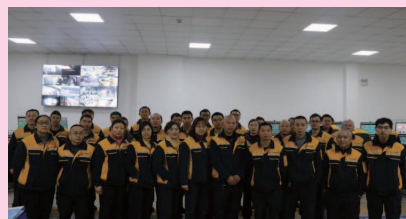
达州公司运行四队