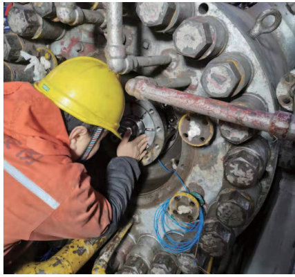
本次检修中，发现105-J氨压缩机机封安装尺寸存在问题。云天化检修人员通过精细地测量机组机械密封的安装尺寸，以数据

说话，并配合机械密封厂家(四川日机)共同分析，修改机封尺寸。下图为吊装轴承座，测量机械密封安装尺寸。