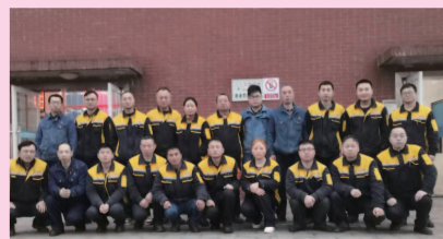
广安公司运行四队