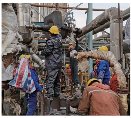
下图为云天化检修人员正在回装103-J高压缸推力瓦块，云天化检修人员针对检修中的各种要求、尺寸认真测量、反复测量，严格控制检修中的每个数据。

下图为云天化正在吊装103-J高压缸内缸及转子，在本次大修中，云天化的所有吊装均由专业吊装人员吊装，针对不同的设备，采用不同的吊装方式及吊装工具，整个吊装以安全第一、保护设备优先的原则。